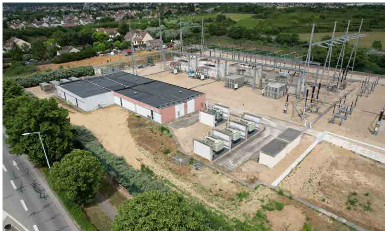
Poste de transformation électrique ENEDIS