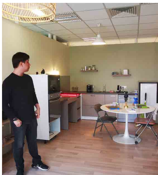
Schowroom AGENCE AUTONOMY