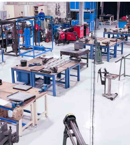
Plateaux techniques AFORP