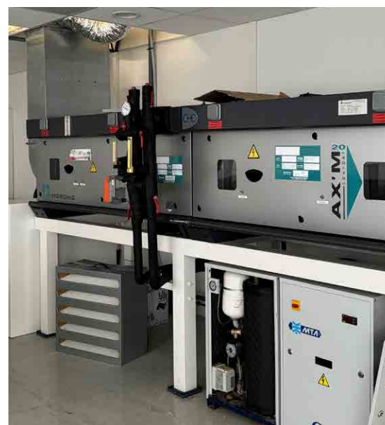
EQUANS FRANCE, GROUPE BOUYGUES