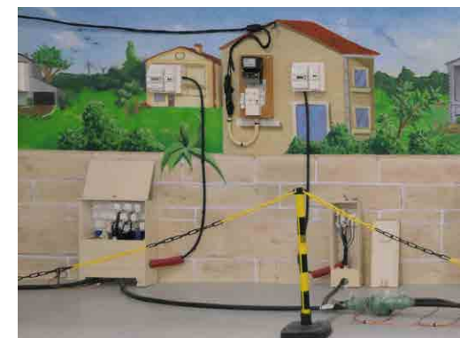
Plateforme AT'OHM ENEDIS