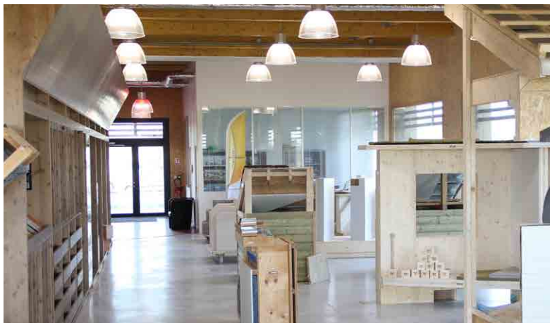
Matériauthèque ENERGIES SOLIDAIRES