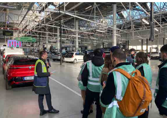
CMQ ICM / REFACTORY

Depuis l'A13 Sortie Mantes la Jolie, suivre l'itinéraire