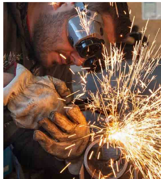
Plateaux techniques AFPA