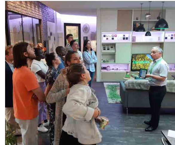
Maison connectée SCHNEIDER ELECTRIC

🚗 Depuis boulevard périphérique, Nanterre, Saint Denis