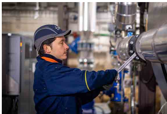
Chaufferie biomasse DALKIA