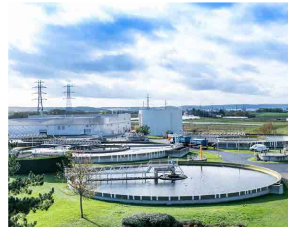
Usine de traitement des eaux SUEZ

🚗 Depuis l'A13 Sortie Flins Aubergenville, suivre l'itinéraire Depuis boulevard périphérique, Nanterre, Saint Denis