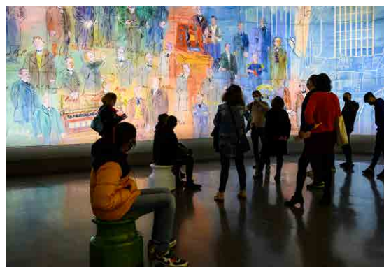
La Fée Electricité de Dufy- Musée d'Art Moderne de Paris/EDF