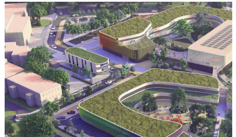
Cité Scolaire GCC