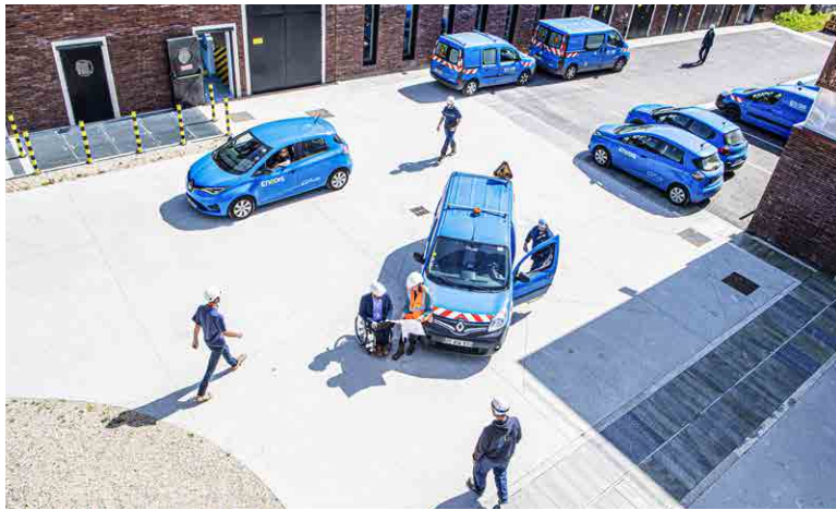
Base opérationnelle ENEDIS