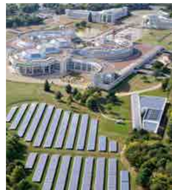
Siège BOUYGUES CONSTRUCTION