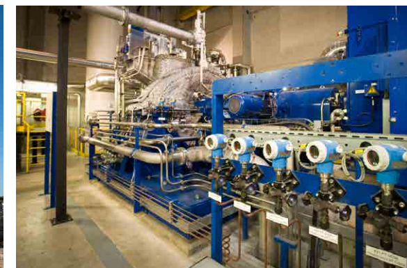
Chaufferie biomasse DALKIA