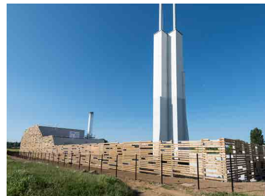
CORIANCE / MBE