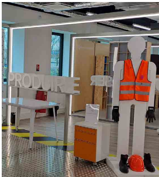
Hub des métiers GIM