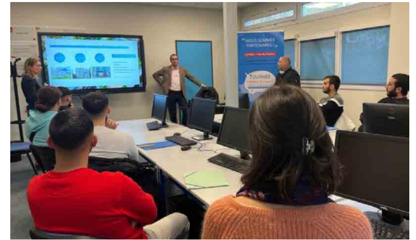
ENGIE HOME SERVICES