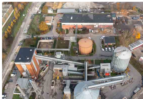
CORIANCE / CENERGY